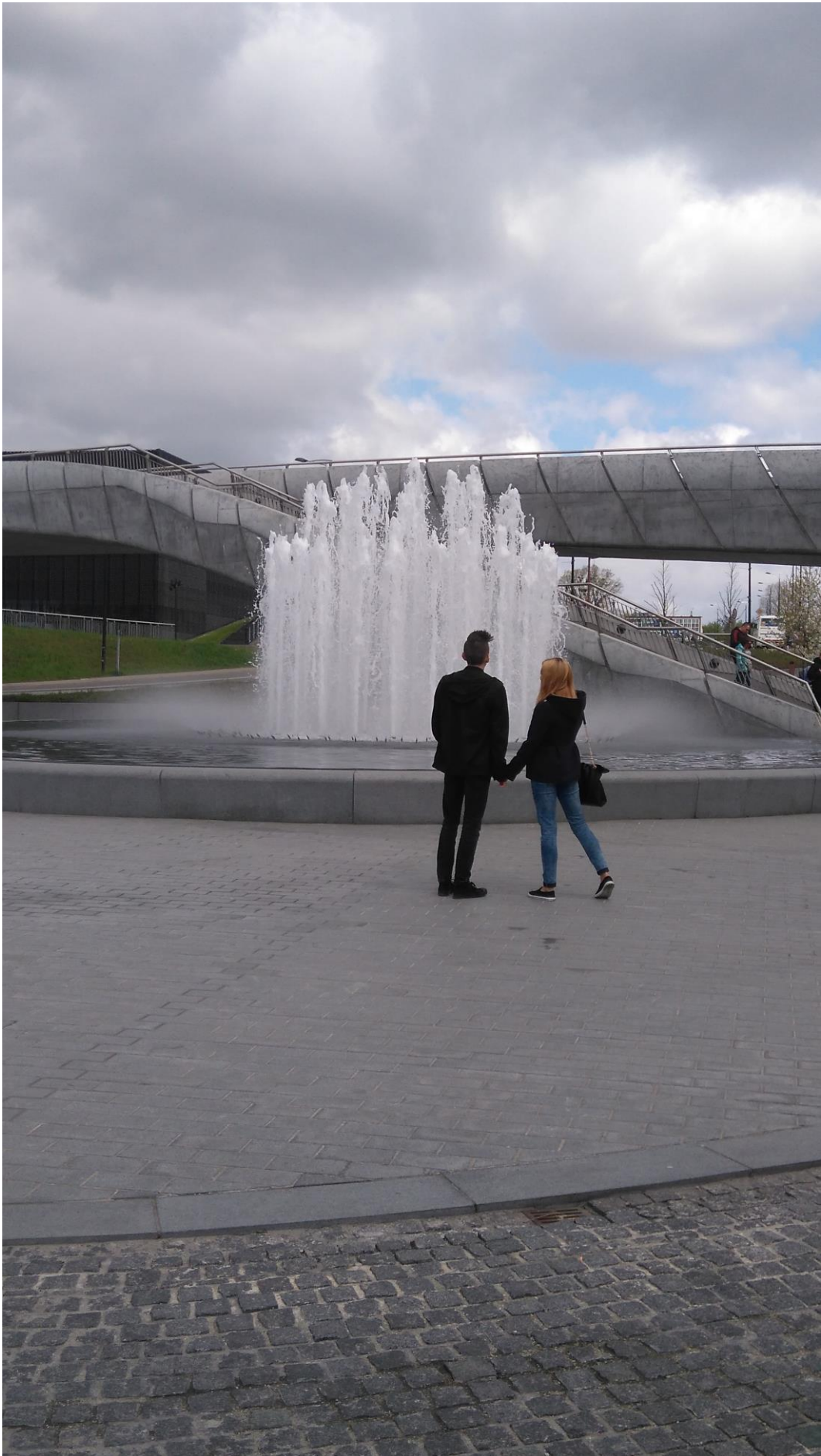
Tekst AW